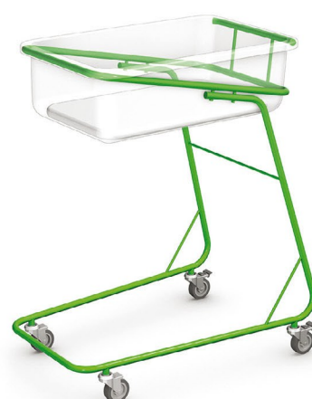
BM-01 opcja: stelaż lakierowany na kolor wg palety RAL