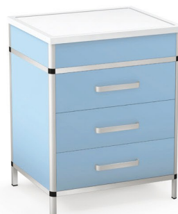
Moduł B - przewijak

Wymiary: 800 x 580 x 900 mm lub 900 x 580 x 900 mm [L x S x H]