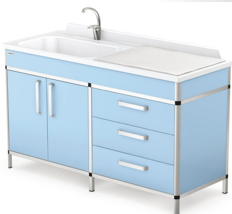
Zestaw AB z blatem monolitycznym, na wspólnym stelażu stelaż anodowany

Elementy stanowiska serii AGATKA wykonano z: stelaż z zamkniętych profili aluminiowych i złączek ABS, anodowany lub lakierowany proszkowo na wybrany kolor wg palety RAL, wyposażony w stopki z możliwością poziomowania wypełnienie z płyty meblowej obustronnie laminowanej blat modułu A (wanienka), U (umywalka) i B (przewijak) z laminatu poliestrowo-szklanego, blat modułu C (stolik zabiegowy) z płyty meblowej przewijak i stolik zabiegowy wyposażone w materacyk