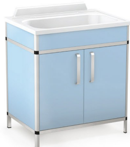
Moduł A - wanienska

Wymiary: 800 x 580 x 900 mm lub 900 x 580 x 900 mm [L x S x H]