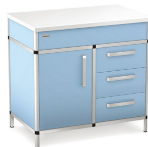
Moduł C - stolik zabiegowy