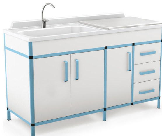
Zestaw AB, z blatem monolitycznym, na wspólnym stelażu lakierowanym proszkowo