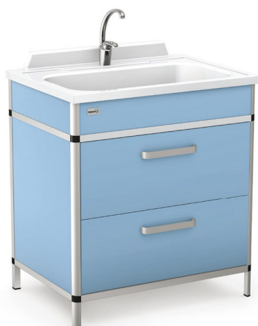
Opcja: moduł A z szufladami