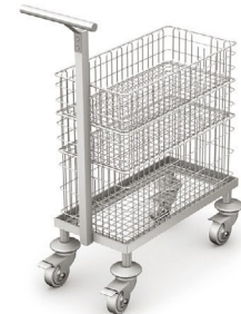
WKS-3 z wyposażeniem

Wymiary całkowite: 700 x 300 x 900 mm [L x S x H]