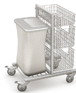
WKS-1 z wyposażeniem

Wymiary całkowite: 550 x 750 x 950-1250 mm [L x S x H]