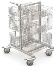
WKS-2 z wyposażeniem

Wymiary całkowite: 550 x 750 x 950 mm [L x S x H]