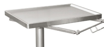
E-01KO i E-01KO-E ze zdejmowalnym blatem