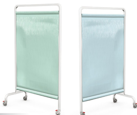
PJ-01 ST (MAT)

Elementy parawanów serii PJ z płytą z tworzywa wykonano z: stelaż z kształtownika giętego stalowego, lakierowanego proszkowo na kolor biały, podstawa z kształtownika stalowego lakierowanego proszkowo na kolor biały, wyposażony w koła o średnicy 50 mm, w tym dwa z blokadą wypełnienie stanowi biała płyta z tworzywa ABS.