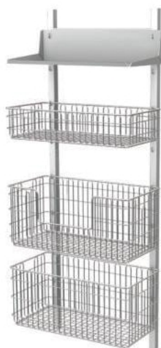
Regał RKS-2 z wyposażeniem

Wymiary: wysokość: 800-1600 mm [H] - w zależności od wyposażenia rozstaw listew: 530 mm