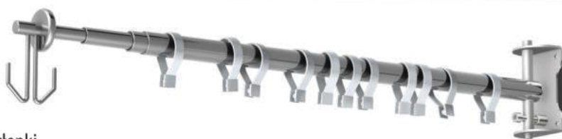
Opcja: KO-2m z uchwytami zasłonki