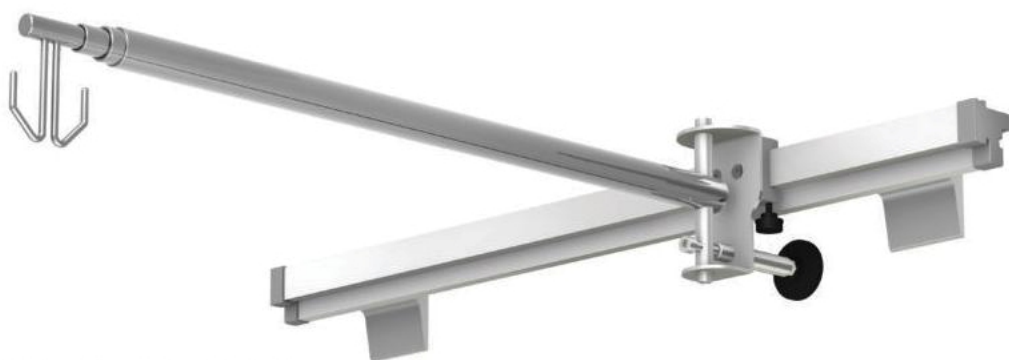
KO-2m z uchwytem na szynę instrumentalną USU2-01