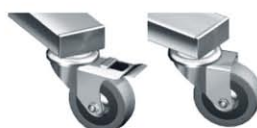
Kółko bez hamulca KL-03