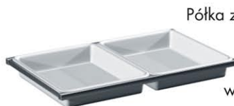
Półka z wymiowanymi kuwetami PW-02