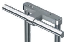
Uchwyt wózka KL-02