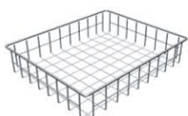
Półka koszowa PK-02