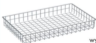
Półka koszowa PK-01

Gamę oferowanych rozwiązań stalowych regałów i wózków systemu RK, RKP i WK wzbogacają przedstawione poniżej półki, kosze i akcesoria. Dzięki nim można dostosować regał lub wózek do własnych potrzeb i rozwiązać problem składowania oraz przewożenia różnorodnych materiałów, produktów i wyrobów medycznych, jak i niemedycznych.