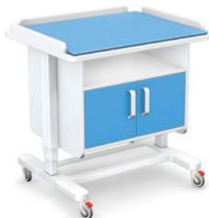
SPM-01 z elektryczną regulacją wysokości