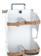
Uchwyt na butlę z tlenem - podwójny