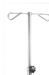
Wieszak z 2 haczykami do kroplówki lub drenów z regulacją wysokości WK-02