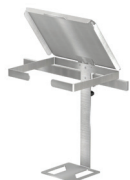
Uchwyt do worka na odpady UWR-03/P-KO/USU-01