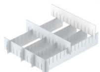
Wyciągane podziałki do szuflad dopasowane do wnętrza szuflady