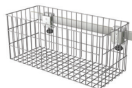
Koszyk duży na akcesoria KR-01KO długość: 360 mm szerokość: 150 mm wysokość: 160 mm