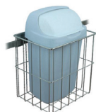
Pojemnik na odpady z tworzywa sztucznego z pokrywą, w obudowie drucianej